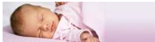
NA ALEGRIA DE UMA CULTURA DE VIDA

Foi por isso que fizemos esta campanha de 40 DIAS PELA VIDA, à porta da clínica dos arcos, (com o apoio da Casa de Nazaré, que está mesmo à frente da clínica e quem quiser pode ficar lá dentro, pois a porta está sempre aberta ) desde o dia 1 de Outubro até 9 de Novembro de 2012, todos os dias das 8h às 22h.