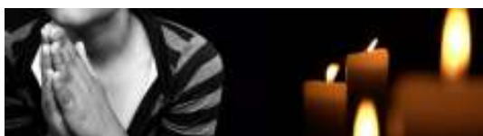
40 DIAS DE ORAÇÃO E ENCONTRO

Na "Clínica" dos Arcos em Lisboa são mortos dezenas de bebés diariamente. Também as suas mães, mais cedo ou mais tarde ficam feridas no mais íntimo do seu ser. A maioria destas mulheres se lhe derem outras opções e apoio não querem mesmo abortar. Nesta "clínica" ninguém se preocupa com a saúde psíquica nem com o sofrimento das mães, e muito menos com os bebés.